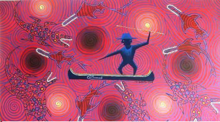
Pintura del pintor kuna, "Achu" Los neles contra espíritus malignos

pensamiento de un Nele, el espíritu, se entiende como “esencia” de un fenómeno, lo que hace un animal sea animal o una persona sea una persona, o una cosa X sea tal cosa. El espíritu también puede ser conciencia, criaturas, árboles, rocas y cosas tiene conciencia similar a nuestra conciencia humana.